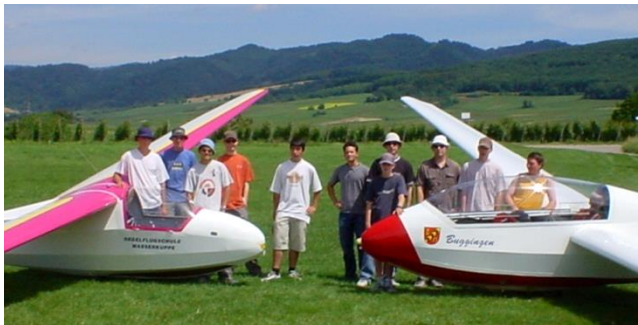
Die Schulflugzeuge und die Jugendgruppe