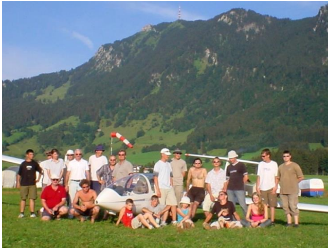
Sommer-Fliegercamp im Allgäu

Viele Aktivitäten, nicht nur fliegerischer Art, werden durchgeführt. So geht die Jugendgruppe in jeden Sommerferien in ein Sommer-Fliegercamp.